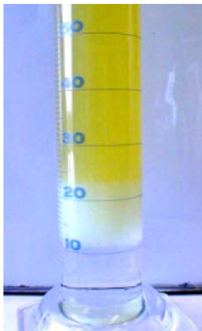
GOM + Actif Détergent/Désémulsionnant MECATECH 200ppm v/v 20 - 2 - 2